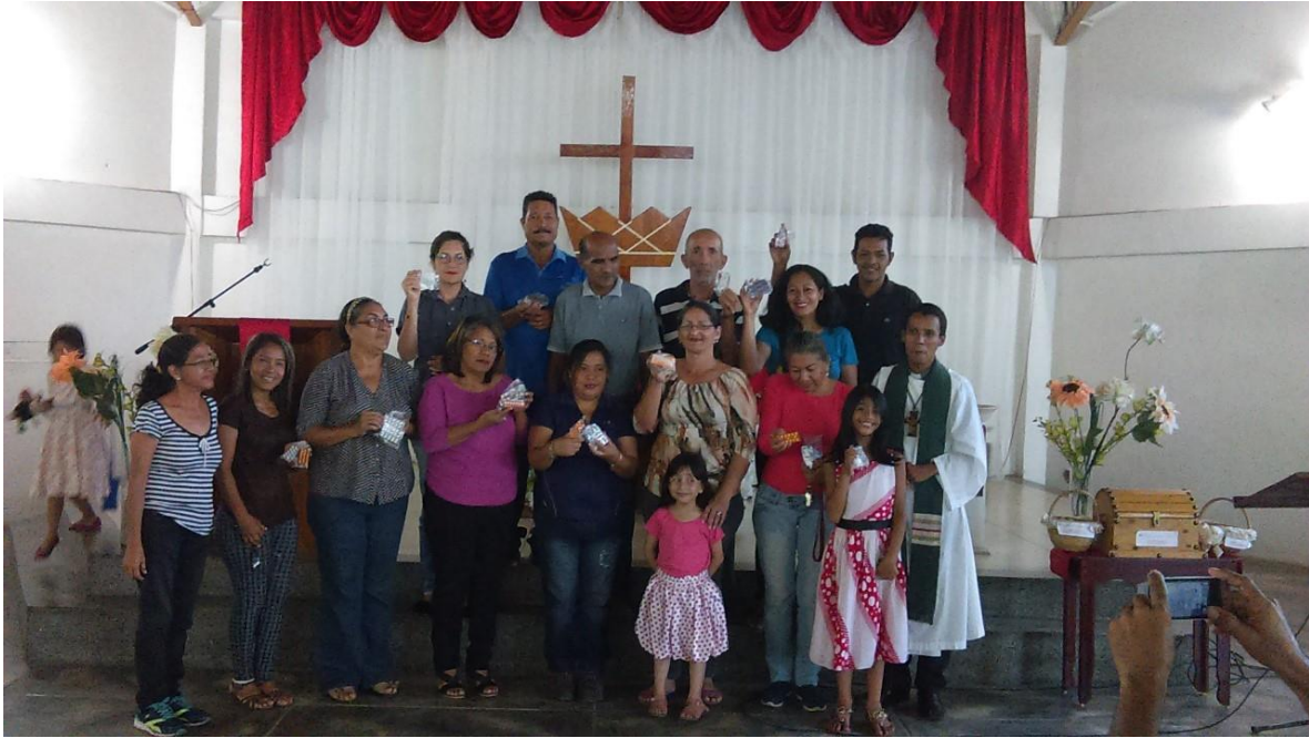
Monagas State 1