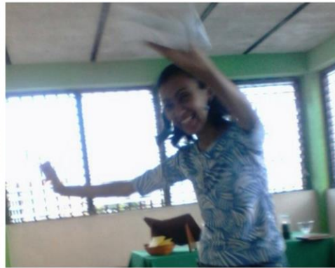
Caracas, Distrito Capital