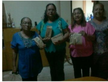
Puerto Ordaz, Bolívar