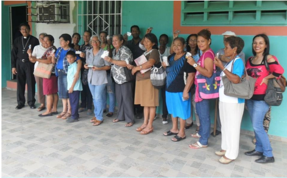
San Felix, Bolívar