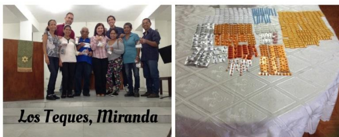
Los Teques, Miranda