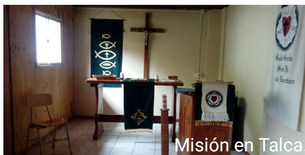
Misión en Talca.

Hoy es un punto estratégico en la proclamación del evangelio en la VII región del Maule.